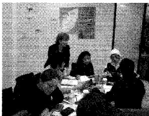
グループでのディスカッションも白熱。

様々なコースがあるコーナーストーン・アカデミック・カレッジ(以下CAC)。一般英語、TESL(英語教授法)、TOEFL、TOEIC、ビジネス英語(3ヶ月コース、終了時ディプロマ授与)、大学準備コースに加え、ニュースやメディア業界を通じて会話やプレゼンテーションの仕方学ぶNews & Media(2ヶ月ディプロマ・コース)や、会社の最高経営責任者とはどのような人物であるべきかを学ぶInternational CEO(2ヶ月コース)、高校や大学進学、またはライティング能力向上を図りたい人へはエッセイの書き方を学ぶWriting & Essayとコースは多種多様。午後に開設されている選択科目も豊富で、例えば、日々の様々な場面を想定し、「こんな時、英語でどう話す?」を学ぶEveryday Englishや、カナディアン・スタイルの会話を楽しむ秘訣を教えるIdioms & Slang、ジャーナリズムの基本が学べるJournalismクラスなど、常に生徒の興味を敏感に察し、生徒が欲しているプログラムを提供し続けている。他ではなかなか見かけないプログラムがあることも魅力的。Bay 駅から外に出る必要がなく、地下通路経由で学校に通えるのも、これからの季節には嬉しい。