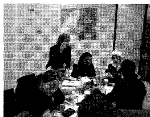
グループでのディスカッションも白熱。

様々なコースがあるコーナーストーン・アカデミック・カレッジ(以下CAC)。一般英語、TESL(英語教授法)、TOEFL、TOEIC、ビジネス英語(3ヶ月コース、終了時ディプロマ授与)、大学準備コースに加え、ニュースやメディア業界を通じて会話やプレゼンテーションの仕方学ぶNews & Media(2ヶ月ディプロマ・コース)や、会社の最高経営責任者とはどのような人物であるべきかを学ぶInternational CEO(2ヶ月コース)、高校や大学進学、またはライティング能力向上を図りたい人へはエッセイの書き方を学ぶWriting & Essayとコースは多種多様。午後に開設されている選択科目も豊富で、例えば、日々の様々な場面を想定し、「こんな時、英語でどう話す?」を学ぶEveryday Englishや、カナディアン・スタイルの会話を楽しむ秘訣を教えるIdioms & Slang、ジャーナリズムの基本が学べるJournalismクラスなど、常に生徒の興味を敏感に察し、生徒が欲しているプログラムを提供し続けている。他ではなかなか見かけないプログラムがあることも魅力的。Bay 駅から外に出る必要がなく、地下通路経由で学校に通えるのも、これからの季節には嬉しい。